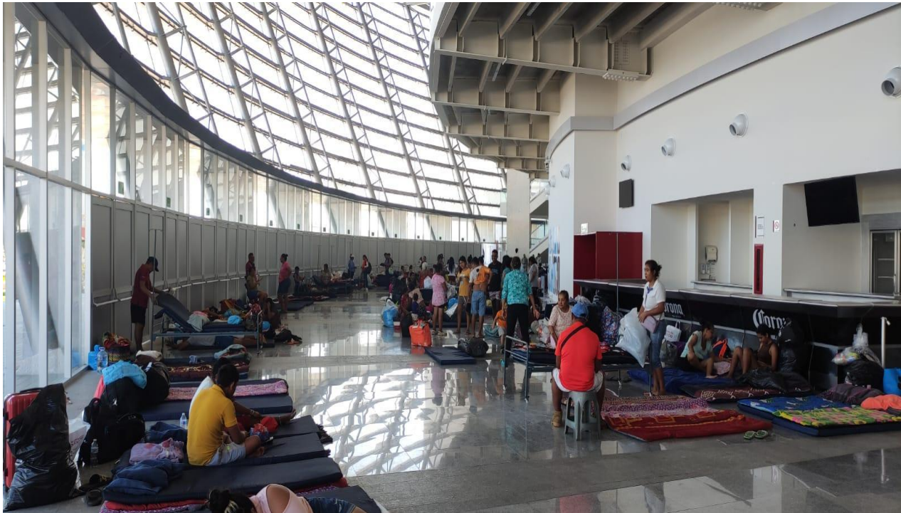
Imagen 2: CNPC, 2024. Atención a las personas refugiadas por el impacto del Huracán John, en el municipio de Acapulco de Juárez, Guerrero.