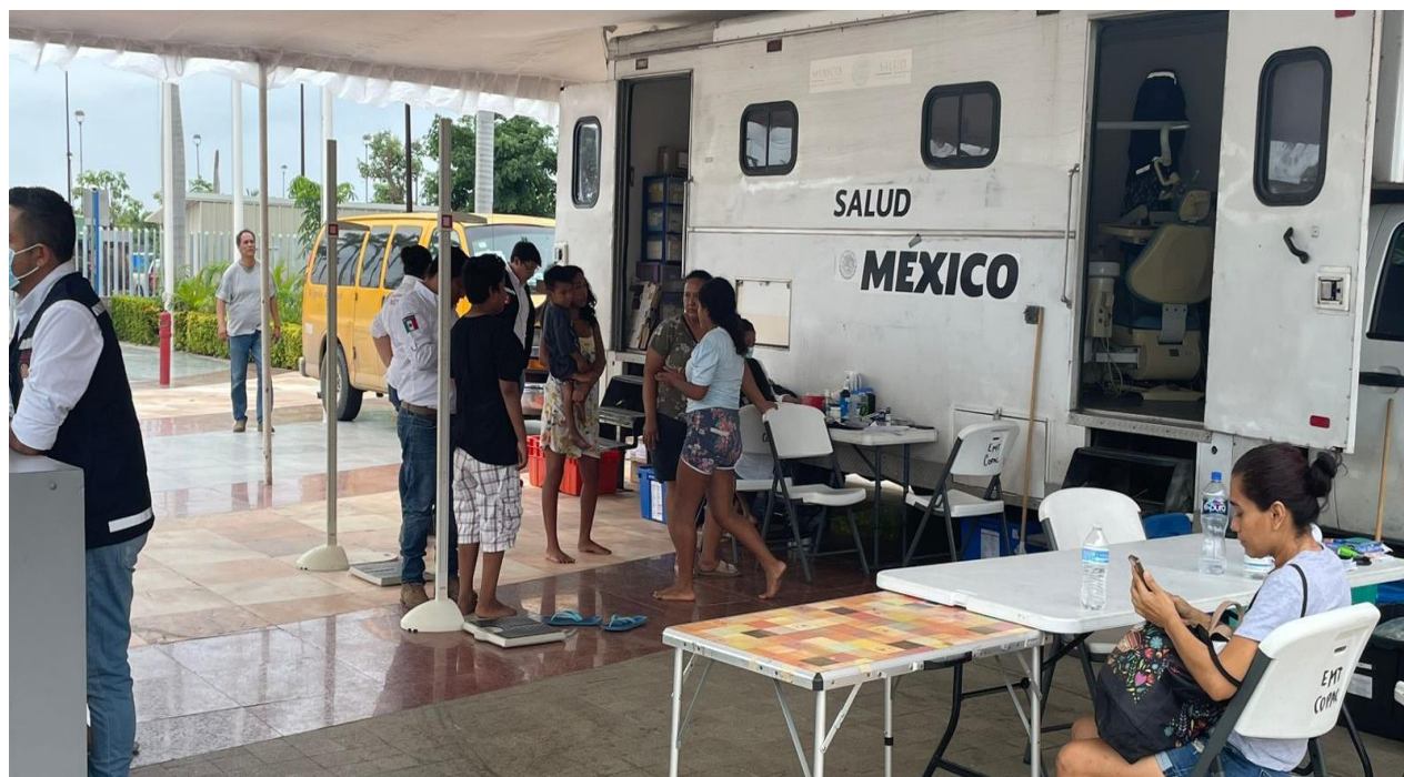
Imagen 6: CNPC, 2024. Durante la atención a las personas refugiadas por el impacto del Huracán John, en el municipio de Acapulco de Juárez, Guerrero.