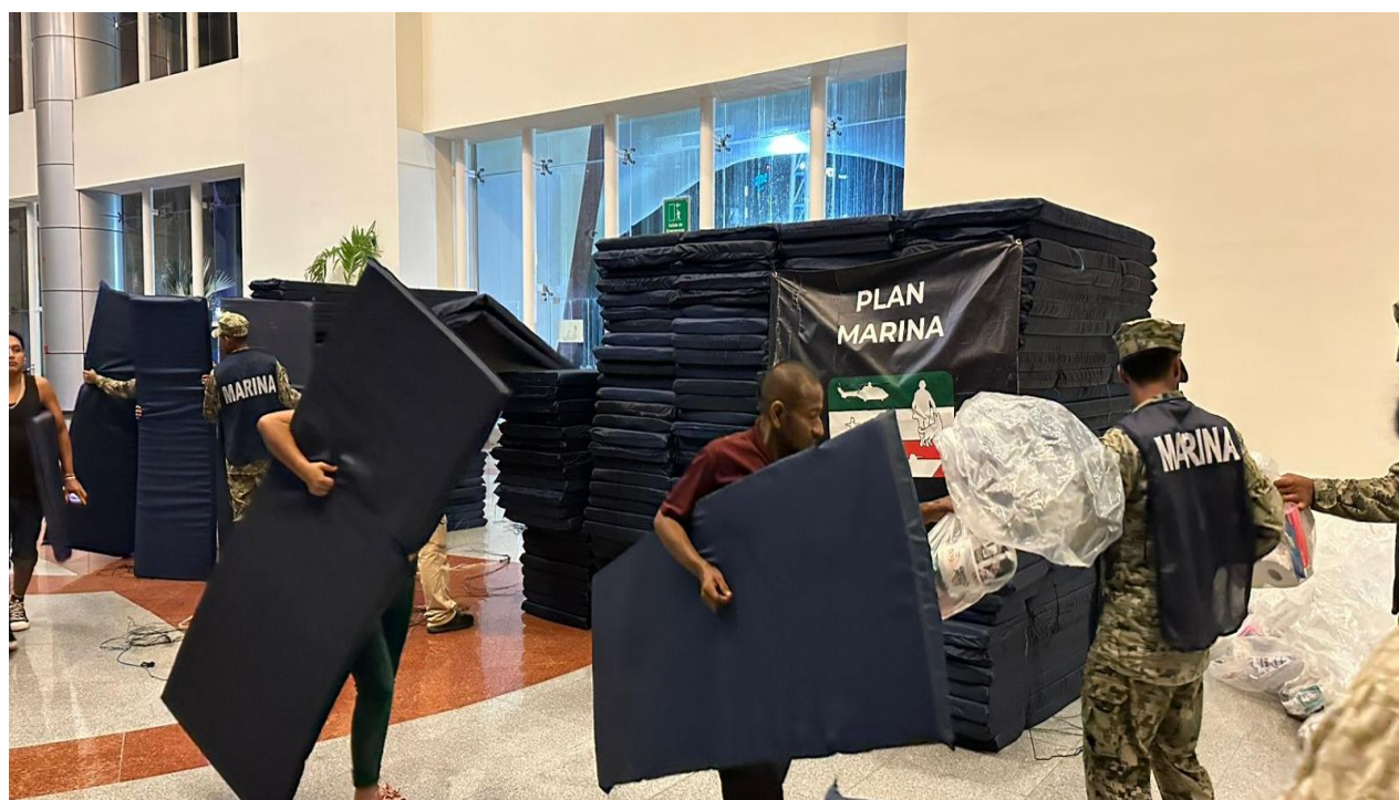
Imagen 5: CNPC, 2024. Entrega de insumos a las personas refugiadas por el impacto del Huracán John, en el municipio de Acapulco de Juárez, Guerrero.

Asimismo, hay que considerar que, en ciertos inmuebles, las fuerzas armadas podrían habilitar cocinas móviles, por lo que requerirán de insumos para la elaboración de las raciones de comida caliente y del desechable para su entrega; debido a esto, la UMPC debe considerar el recurso para adquirir lo anterior durante la operación de los RT.