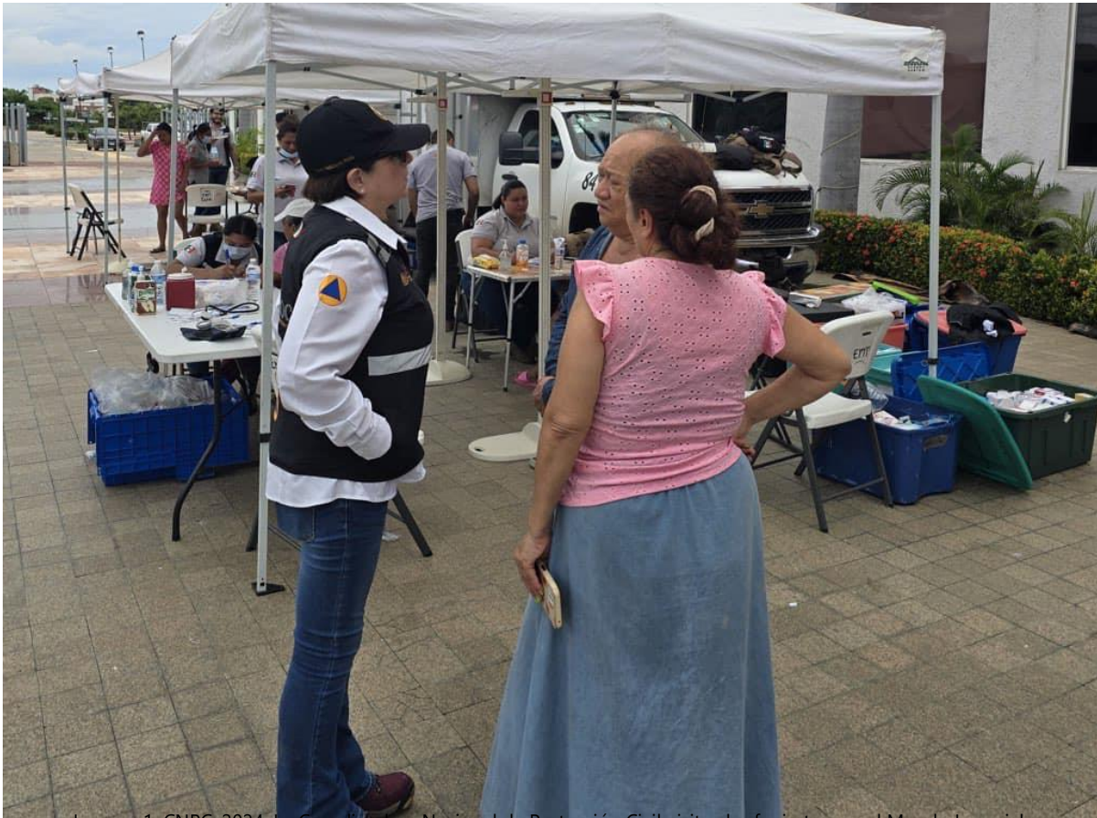
Imagen 1: La Coordinadora Nacional de Protección Civil visita el refugio temporal Mundo Imperial, en Acapulco de Juárez, Guerrero.

La etapa de preparación en la LGPC se define como: "actividades y medidas tomadas anticipadamente para asegurar una respuesta eficaz ante el impacto de un fenómeno perturbador en el corto, mediano y largo plazo". Es el momento justo para que las Unidades Municipales de Protección Civil (UMPC) y las Coordinaciones Estatales de Protección Civil (CEPC) comiencen la planeación para atender a la población en situación