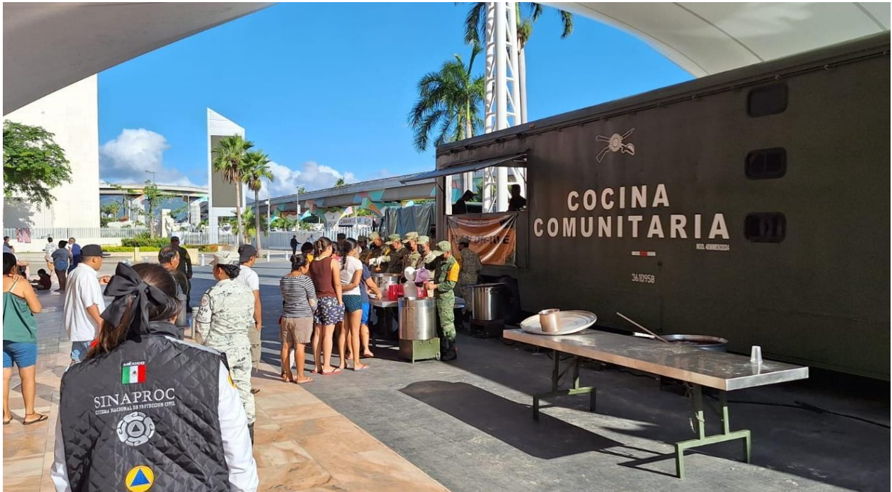
Imagen 7: CNPC, 2024. Entrega de alimentos a las personas refugiadas por el impacto del Huracán John, en el municipio de Acapulco de Juárez, Guerrero.