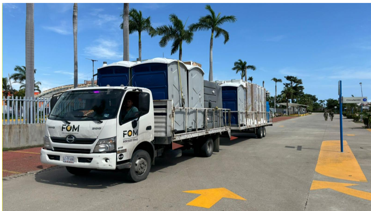
Imagen 3: CNPC, 2024. Recepción de letrinas móviles en el RTR Mundo Imperial en el municipio de Acapulco de Juárez, Guerrero.

Con independencia de las instalaciones fijas con las que cuenten los inmuebles seleccionados y tomando en consideración que en caso de desastre concentrarán una cantidad de personas que pudiera superar su capacidad instalada, los administradores podrán determinar si se requiere de equipamiento complementario, como cocinas móviles, o de servicios adicionales, como sanitarios y regaderas mixtas, entre otros.