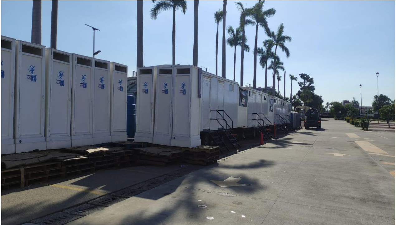
Imagen 4: CNPC, 2024. Atención a las personas refugiadas por el impacto del Huracán John, en el municipio de Acapulco de Juárez, Guerrero.